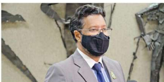
Projeto do vereador Galhardo prevê que o carnê do IPTU contenha a informação quanto ao direito de isenção do imposto

Elson Marques - EMS Editores com assessoria CMFI Reportagem