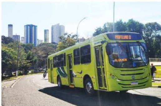
Trabalhadores do transporte coletivo de Foz do Iguaçu podem decretar nova greve a partir desta terça, 9

Em relação ao vale alimentação, o Sitrofi informa que há um ano e meio que duas empresas (Viação Cidade Verde e Expresso Vale do Iguaçu) deixaram de pagar o benefício no