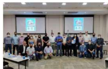
Representantes da Prefeitura e Câmara de Vereadores de Londrina foram recebidos em Foz

Após o encontro de apresentação durante a manhã, os secretários de ambos os municípios participaram de reuniões ao longo do dia com seus pares para as apresentações de projetos já aplicados em Foz, nas áreas de fazenda, administração, turismo, empreendedorismo, obras, des-