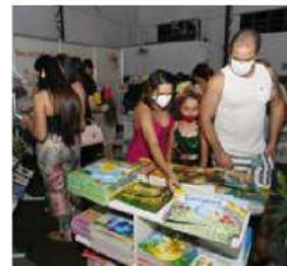
A 16ª edição do evento, promovida pela Fundação Cultural, acontece no Clube Gresfl

A curadoria da Feira do Livro preparou uma lista de grandes atrações para todos os dias do evento. Além dos autores