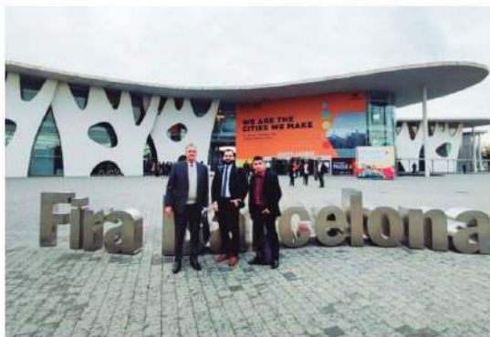
Comitiva iguaçuense participa da Smart City Expo World em Barcelona

"Participar do Congresso de Cidades Inteligentes é uma oportunidade única de ver o que está acontecendo no mundo e como podemos cada vez mais humanizar nossas cidades, utilizando as tecnologias para proporcionar uma melhor qualidade de vida para a população, fomentar e diversificar a economia local, gerando emprego e renda," frisou.