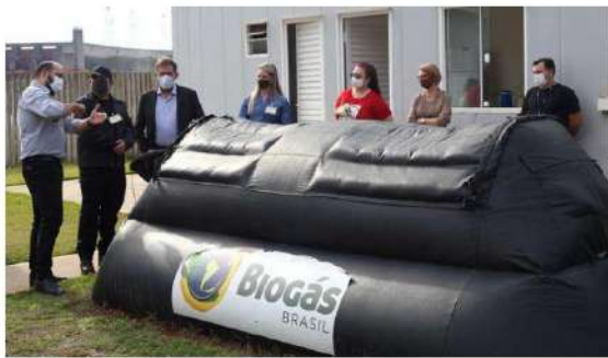
Prefeitura de Foz vai comprar de 120 biodigestores

Outro benefício da aquisição dos equipamentos apontado pelo prefeito é a produção do biogás, em substituição ao gás butano - que, além de poluente, teve um aumento de preço de quase 30%. "Nas escolas e cen-