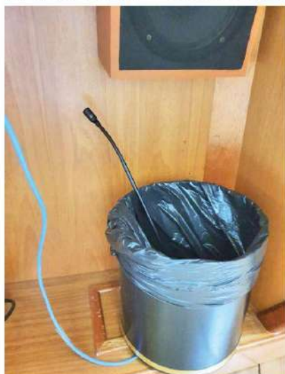
Microfone jogado no lixo foi fotografado e a imagem anexada na denúncia

de qualidade mas o equipamento deixa muito a desejar", dizem os servidores.