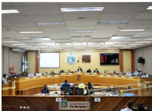
A retomada do turismo em Foz do Iguaçu foi debatida durante audiência pública na Câmara

"Queremos aprender com vocês o que se faz melhor no turismo, no desenvolvimento, isso de fato é importante", des-