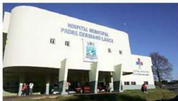
Inscrições podem ser feitas a partir de segunda-feira (08) até o dia 16 de novembro

As inscrições devem ser feitas de forma presen-