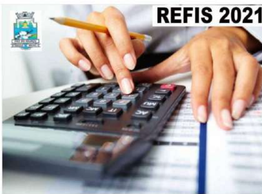
Projeto de Lei Complementar amplia as vantagens do Refis 2021 e prorroga o prazo até 29 de dezembro

O valor de cada parcela não poderá ser inferior ao valor atual de uma Unidade Fiscal do Município (UFFI) que é de R$ 91,61. Algumas opções de pagamentos a vista que terminaram em agosto ou outubro estão sendo reeditadas. E as demais facilidades que terminariam no dia 20 de dezembro será estendida até 29 de dezembro.