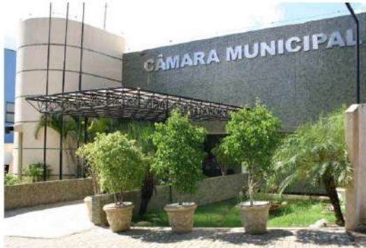
Projeto enviado ao Legislativo propõe a revogação da Lei do Alvará Social

"Com o advento da legislação federal e mu-