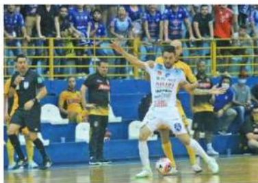
Foz Cataratas Futsal empatou em 1 a 1 contra o Magnus