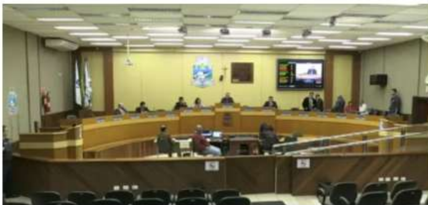
Câmara de Foz do Iguaçu aprova aumento da taxa de coleta de lixo

Os novos valores, segundo a prefeitura, passarão a ser cobrados a partir de 2022.