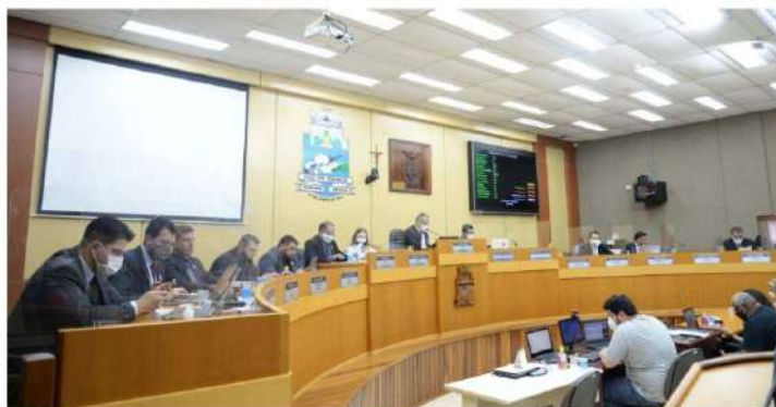
Vereadores aprovam aumento do valor da taxa de coleta de lixo para o ano que vem