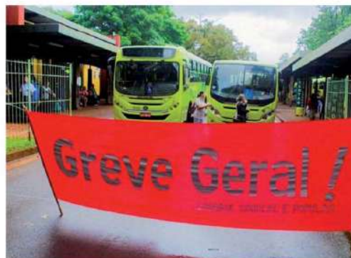
Queda de braço entre trabalhadores e empresários tem resultado em greves constantes e embaraço aos usuários

Alega prejuízos durante a pandemia que ultrapassam os R$ 55 milhões e pediram ao Foztrans o reequilíbrio do contrato. Apresentaram planilha que elevaria a passagem para R$ 11,64. Dizem que não terão como pagar o 13º salário.