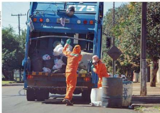
O aumento da taxa de coleta de lixo em Foz atingirá 92.123 imóveis