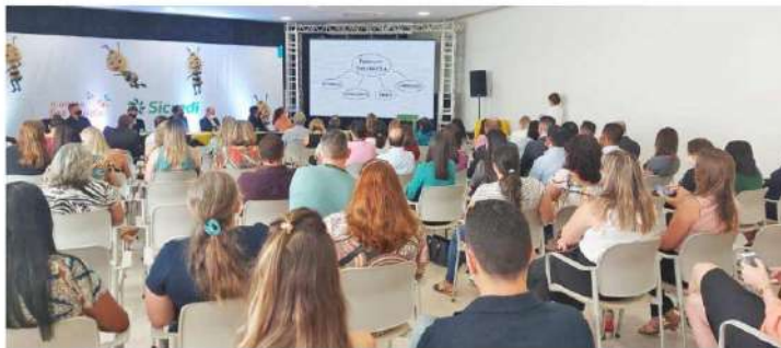
Evento também comemorou o Dia do Diretor