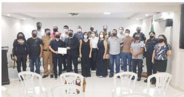
Diretoria do Conselho de Segurança do Setor Oeste abrange a Vila Portes e região

Diretoria do Conselho de Segurança, que abrange a Vila Portes e região, está oficialmente reconhecida pela Secretaria de Estado