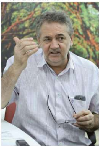
Trabalhadores do transporte coletivo de Foz do Iguaçu podem decretar nova greve a partir desta terça, 9

A greve foi definida pela direção do sindicato após uma série de reuniões com representantes do consórcio. De acordo com estimativa da instituição, o prejuízo acumulado pelos motoristas de duas empresas, sem as reposições, é superior a R$ 12 mil. Já os trabalhadores da terceira empresa, os valores somam aproximadamente R$ 5 mil.