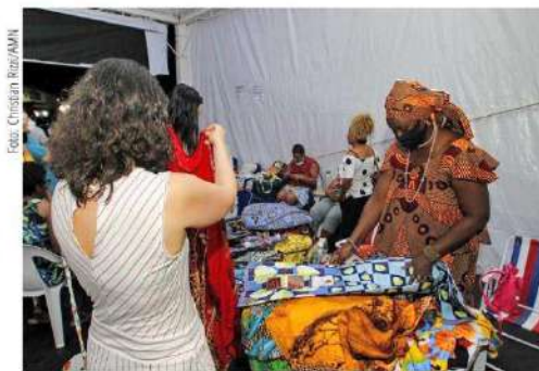
Mostra de Cultura Afro-brasileira segue até o dia 27 de novembro, no Clube Gresfi

Os dados levantados pelo Instituto Maria da Penha mostram a triste realidade. Em 2020, mais de 17 milhões de mulheres foram vítimas de algum tipo de vi-