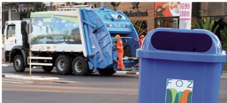
Veredores de Foz decidirão sobre aumentar ou não o valor da taxa de coleta de lixo

Depois da aprovação de uma emenda, a proposta do prefeito foi incluída na ordem do dia em regime extraordinário