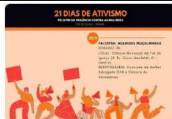
Evento do Legislativo será realizado nesta quinta-feira, 25/11, às 9h no plenário da Casa

A parlamentar ressaltou ainda que a educação de jovens e adultos é uma modalidade de ensino e componente constitutivo de educação básica e não mais um subsistema de ensino, com funções reparadora, equalizadora e qualificadora, obedecendo a princípios como equidade e proporção. O requerimento foi aprovado em plenário por unanimidade em única votação. (DC CMFI)