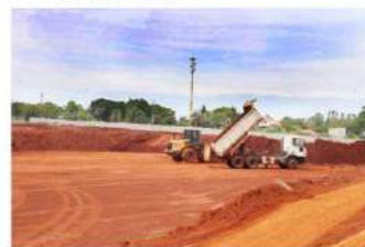
Construção do espaço foi dividida em três fases; espaço será referência para grandes eventos de automobilismo

Já a última etapa prevê os trabalhos de construção da pista, estacionamento, boxes e arquibancadas, calçadas, paisagismo, entre outros serviços. (AMN)