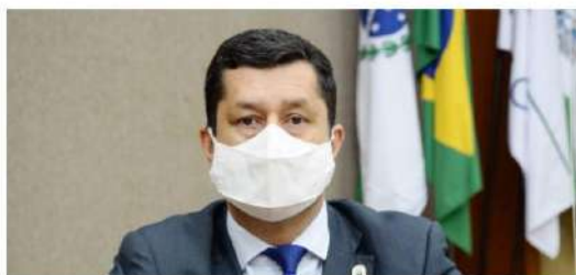
Quadros: "Tão logo recebemos, marcamos a audiência pública para dar transparência e chamar a sociedade para debater a LOA do próximo ano"

No último dia 17, representantes de entidades e a população em geral participaram da audiência pública na forma presencial (com limitação de público) ou por meio da transmissão ao