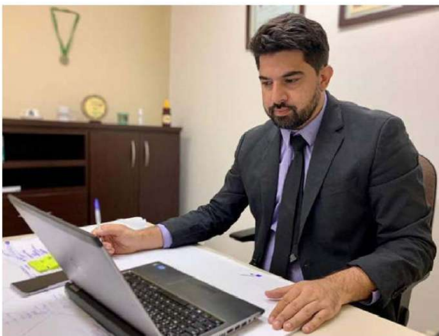
Preparem o bolso porque se a Câmara não rejeitar e votar contra, serão mais de 22 mil casas atingidas em cheio com o pacote de Natal tirando isenção de quem a tem e aumentando a taxa do lixo

Adnan ressaltou a vontade que muitos jovens da cidade têm de ingressar na Unila, IFPR e Unioeste e dis-