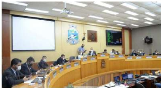
Vereadores pedem ao Estado a instalação de curso de medicina no campus da Unioeste em Foz

O curso de medicina da Universidade Estadual do Oeste do Paraná (Unioeste) campus iguaçuense - é um sonho antigo, tanto da instituição de ensino, quanto do município de fronteira. A referida graduação já é realidade nos campi de Cascavel e Francisco Beltrão. Em vista disso e considerando a insuficiência de profissionais de medicina na região e também visando fortalecer a política de interiorização, os vereadores aprovaram uma Moção de Apelo (19/2021) ao Governo do Estado do Paraná pela instalação do curso em Foz. Com a aprovação, a moção será encaminhada à autoridade competente. "A Universidade de Integração Latino-Americana (Unila) já trouxe a medicina para nossa cidade, mas com certeza Foz pode ir muito mais além. Pode suprir em muito a carência para o setor que trabalha com vidas. Foz vem se toman-