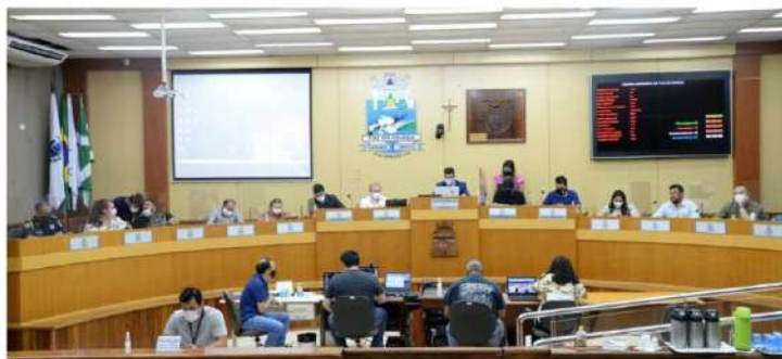
Vereadores discutiram em audiência pública a Lei Orçamentária Anual e Plano Plurianual de Foz

Vereadores agora trabalham na finalização das emendas da LOA e nos pareceres dos projetos