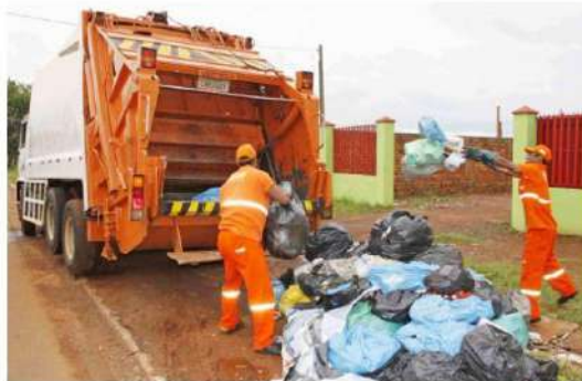
Projeto que aumenta valor da taxa da coleta de lixo deve ser votado nesta quinta-feira

Após votada a emenda, a nova redação do projeto poderá ser incluída na ordem do dia de votação das próximas sessões. Para ser aprovado, o projeto precisa obter 8 votos (maioria absoluta). Os vereadores entendem que o pedido de