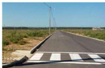
Prefeito pediu a retirada do projeto que reduziria a largura das ruas de 17 para 16 metros

Ofício enviado ao presidente da Câmara pede retirada do projeto que reduziria a largura das ruas de 17 para 16 metros