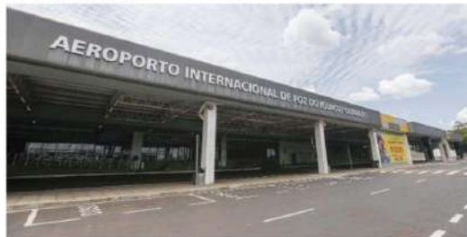
Começa neste mês a transição para a CCR assumir a gestão integral do Aeroporto de Foz do Iguaçu

O recrutamento está sob responsabilidade do Gi Group Brasil, um dos líderes globais em soluções dedicadas ao desenvolvimento do mercado de trabalho. Para o Aeroporto de Foz do Iguaçu as vagas abertas são para Agente de Atendimento, Fiscal de Pátio, Operador(a) APOC ou Supervisor(a). O link para se candidatar é o www.contratando.com.br