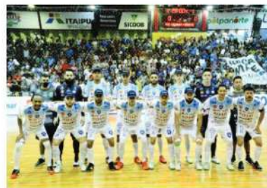
O Azulão das 3 Fronteiras está entre os quatro melhores times do Brasil

Binacional, a Prefeitura de Foz do Iguaçu, a Câmara de Vereadores, o Sicoob Três Fronteiras e o deputado Hussein Bakri, líder do governo na Assembleia Legislativa do Paraná.