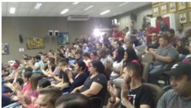
Motoristas de aplicativos lotam a Câmara de Vereadores de Foz do Iguaçu

Dezenas de motoristas de aplicativos de transporte compartilhado participaram da sessão desta quinta-feira (3) na Câmara de Vereadores de Foz do Iguaçu, no oeste do Paraná. O objetivo era apresentar as reivindicações da categoria aos vereadores.