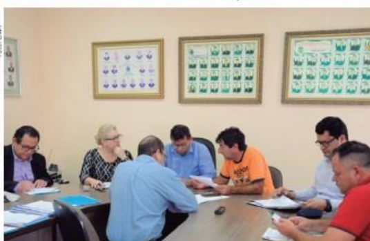
Vereadores vão iniciar a discussão do orçamento da Prefeitura de Foz para 2020

O percentual que o prefeito inseriu na proposta para livre remanejamento, ou seja, o que não precisa passar pela aprovação da Câmara, é de até 8% da despesa. O Executivo ressaltou que em obras públicas e materiais e equipamentos permanentes estão previstos R$ 106 milhões, além do que já está em execução ou o que ainda será empenhado em 2019. Segundo a prefeitura,