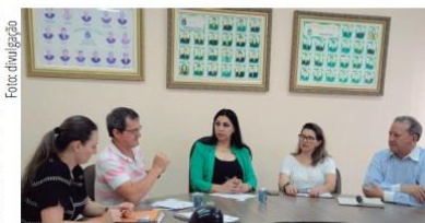
Vereadores e autoridades preparam a audiência pública para a próxima sexta-feira (11)

Ainda como parte da preparação para a audiência pública houve reu-