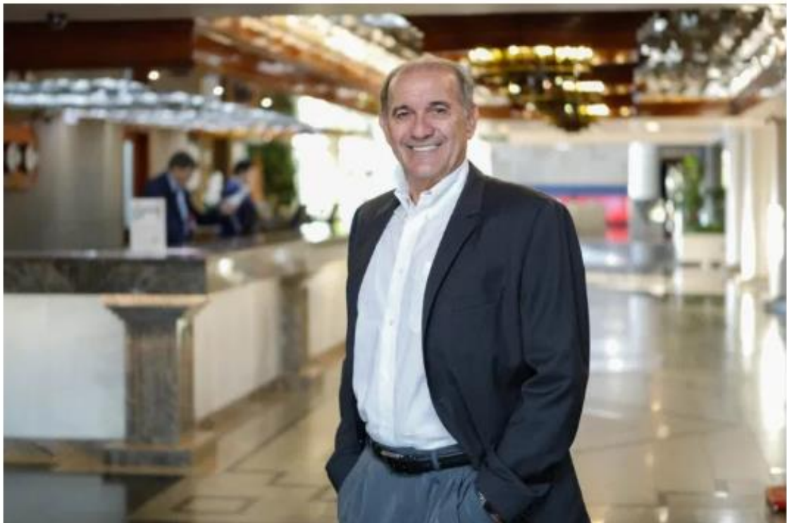
O novo Cidadão Honorário de Foz do Iguaçu.

2 Outubro, 2019 By Vínicius Ferreira — Deixe um comentário