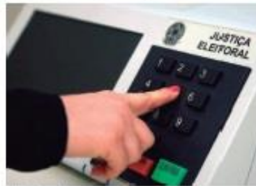
Fim das coligações proporcionais deixa um pouco mais igualitária as condições dos partidos para eleger vereador

"Por exemplo, um partido que tem dois vereadores, alguns bons puxadores de votos, podem decidir a ir para outros partidos que não tenham vereadores", ressaltou o dirigente partidário. De acordo com ele, tudo é muito relativo, "dependendo da forma como é