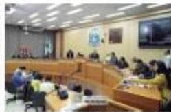
Vereadores cobram melhorias na saúde, equipamentos e planos de carreira

Ao ser procurada por um paciente, que há quatro anos fez uma cirurgia bariátrica e sobre ele hoje com o acesso de pele, após a perda de 75 quilos, a vere-