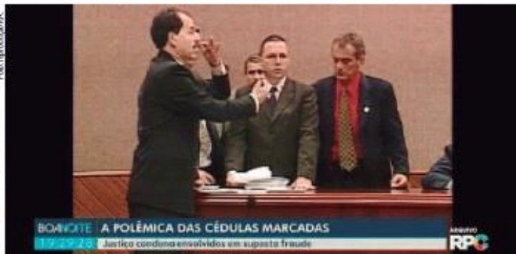
Tumulto na eleição de 2002 foi registrado pela imprensa