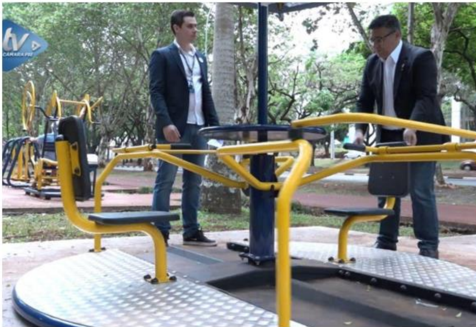
Parquinhos adaptados promovem a integração para crianças com deficiências

A Avenida Paraná e a praça da Avenida Mário Filho já foram contempladas com a instalação de parquinhos adaptados para deficientes físicos. A prefeitura está implantando devido ao projeto de lei criado pelo vereador Jeferson Brayner (Republicanos) que dispõe sobre a obrigatoriedade desses equipamentos. Por meio de emenda impositiva, o vereador também disponibilizou cerca de R$ 200 mil para essas instalações que promovem inclusão, integração e acessibilidade. Outras regiões da cidade também serão contempladas com esses aparelhos adaptados.