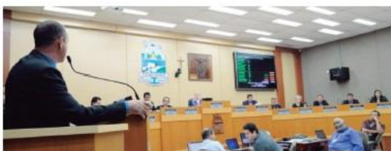
Câmara ajuda a agilizar a atenção na saúde pública

A atual legislatura começou em 2017 com o orçamento da saúde já aprovado pela anterior no valor de R$ 213,7 milhões. Para o orçamento do ano seguinte (2018), os vereadores aprovaram o valor de R$ 266,7 milhões, incluindo o reforço de R$ 5,2 milhões em emendas impositivas. Para este ano, o reforço em emendas im-