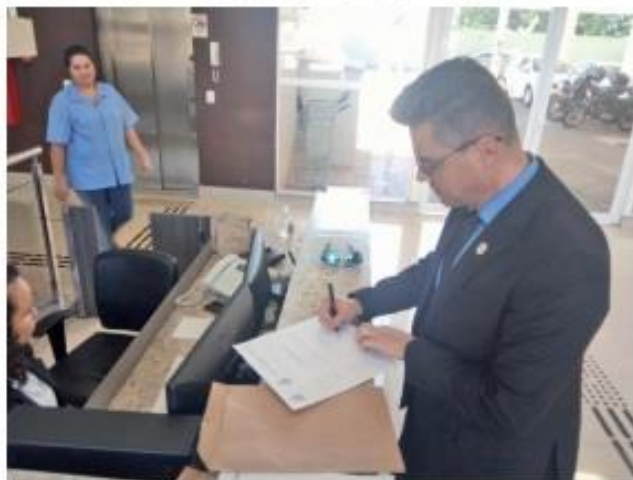
O ofício foi protocolado na Ministério Público na última quinta-feira (10)