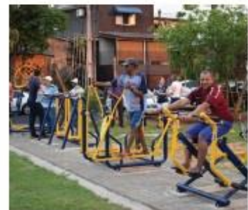
Moradores aprovam os equipamentos instalados

A academia da Vila Shalon está instalada na Rua Natal Graciotin, próximo ao nº 393. O equipamento foi construído com recursos da emenda impositiva do vereador Elizeu Liberato. "Nos últimos meses, já instalamos quase 70 academias da terceira idade em todas as regiões da cidade. E nos próximos dias entregaremos novos equipamentos de lazer para as famílias em outros