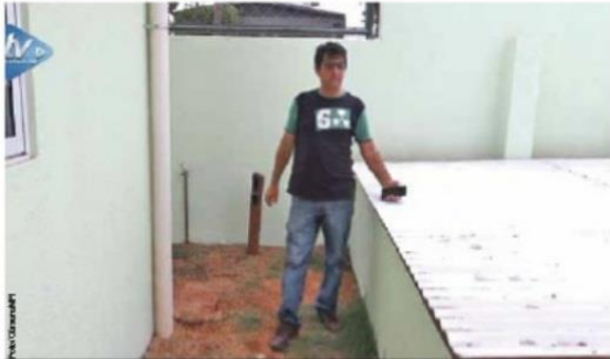
A região do Porto Meira já conta com o sistema na unidade de saúde do CAIC.