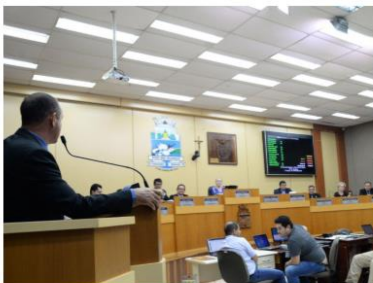
Câmara ajuda a agilitar a atenção na saúde pública