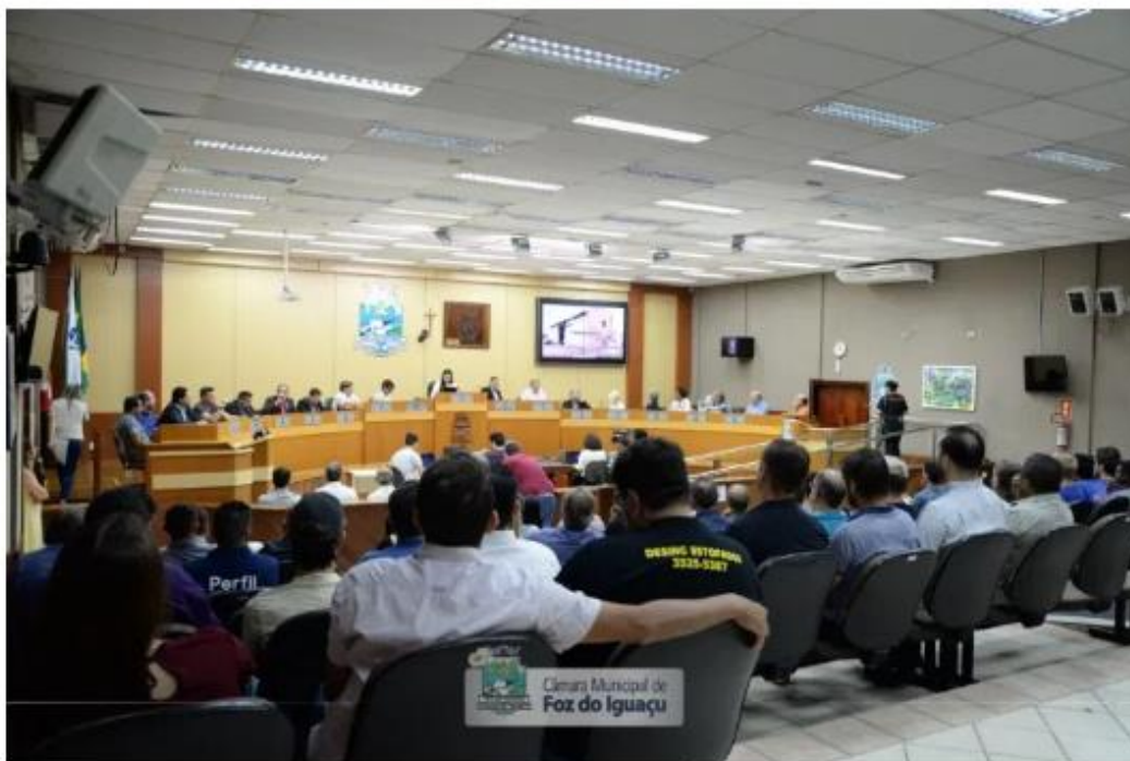
A Audiência Pública reuniu dezenas de interessados.

11 Outubro, 2019 By Viniçius Ferreira – Deixe um comentário