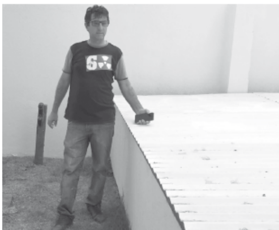
Lei do vereador Narizão obriga poder público a instalar cisternas nos prédios do município

As cisternas estão sendo construídas em novas unidades básicas do município, cooperando assim para o meio ambiente também. Tudo em obediência a Lei do vereador Narizão.