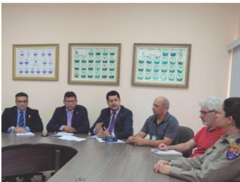
Os vereadores e técnicos estudaram medidas para resolver ou amenizar os problemas das enchentes

O drama dos alagamentos em que as pessoas perdem tudo o que trabalham anos para conquistar tem um caminho em andamento, buscando a solução definitiva. O assunto teve intensa participação da Câmara Municipal, por meio de uma comissão especial que estudou, dialogou com técnicos e acompanhou medidas para a solução desse problema que a população iguaçuense enfrenta há décadas.