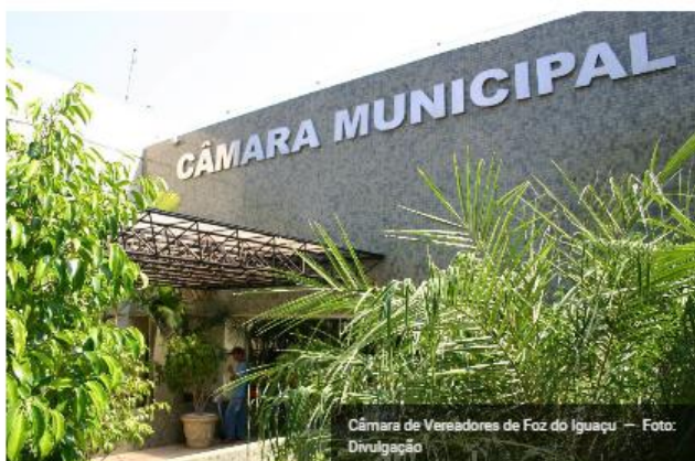
Câmara de Vereadores de Foz do Iguaçu

Foz do Iguaçu – As CPIs (Comissões Parlamentares de Inquérito) que investigam indícios de fraude na licitação do transporte coletivo e que apura e investiga indícios de irregularidades no Consórcio Condoexte, na Câmara de Foz do Iguaçu, realizaram reuniões nessa segunda-feira (7) para definir alguns passos das comissões.