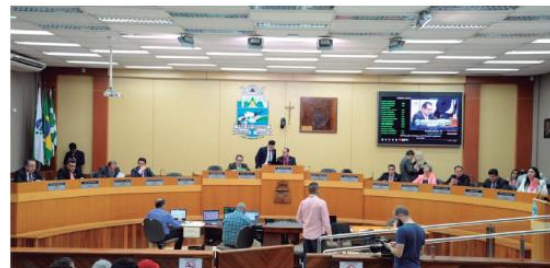
Uma das propostas reforça o quadro de pessoal na atenção básica do município, o que é uma das demandas antigas

Um dos avanços é que o município passou a otimizar os recursos gastos com hora extra e horaplantão passando a contratar, via concurso público, novos funcionários para ampliar os serviços principalmente na atenção básica. Foram criadas, entre outras, 55 vagas para enfermeiros, oito para fisioterapeutas e oito para fonoaudiólogos, além de 18 para médicos, entre veterinários e sanitários, mais cinco terapeutas ocupacionais e cinco para psicólogos.