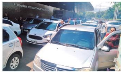
Motoristas que usam aplicativos para o transporte de passageiros querem mudança profunda na lei que regulamenta o serviço em Foz

A proposta do Poder Executivo, que tramita sob o número 137 na Câmara, busca adequar a prestação do serviço. Os condutores vinculados às empresas operadoras terão