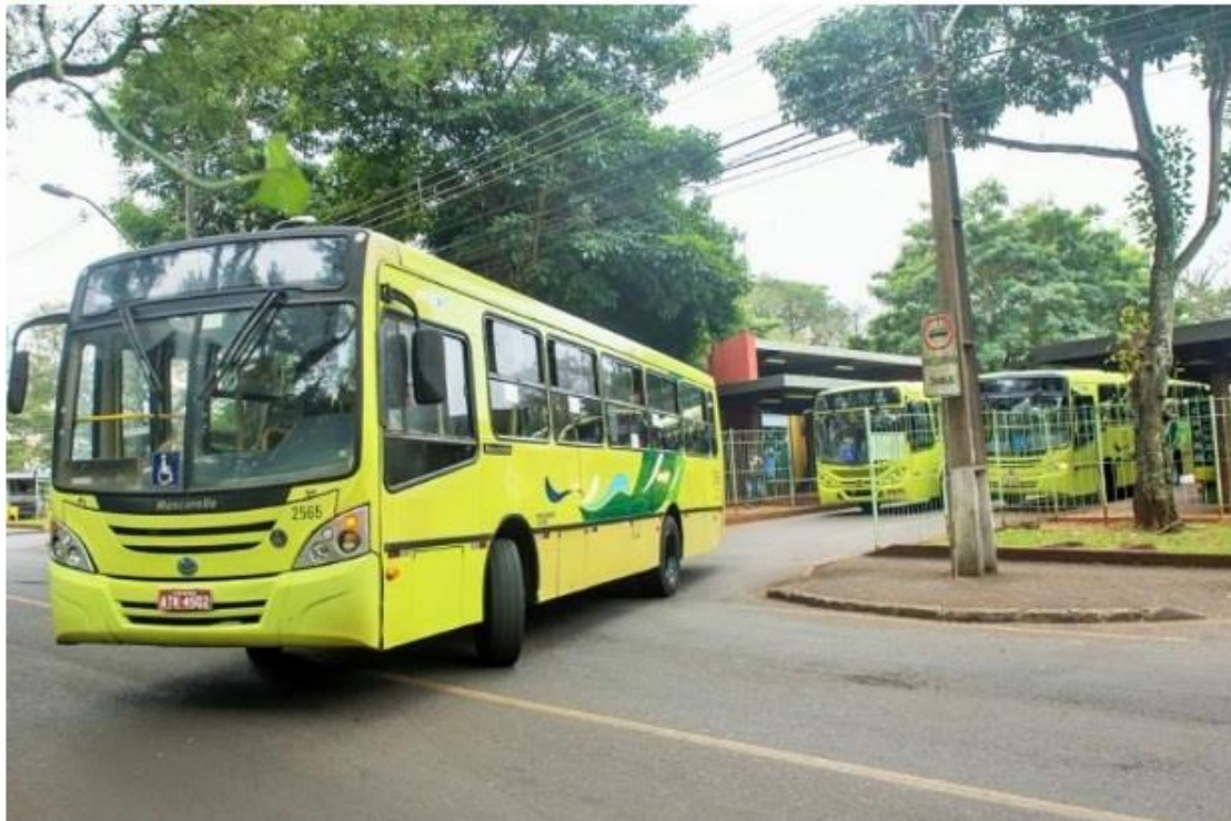
Ato público e panfletagem acontecem no terminal; entidades estenderão mobilização à Câmara de Foz

Entidades sociais e estudantes organizam uma manifestação contra o aumento da passagem de ônibus, para esta sexta-feira, 1º, a partir das 15h30, no Terminal de Transporte Urbano (TTU). No espaço, realizarão ato público e panfletagem para questionar o reajuste da tarifa – de R$ 3,75 para R$ 3,95, conforme divulgou a prefeitura – e a "qualidade do serviço" prestado à população.