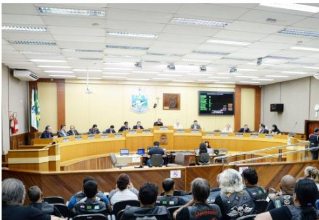
União dos motociclistas marcou presença na Câmara para acompanhar a sessão

Durante a sessão realizada na terça-feira (8) os vereadores da Câmara Municipal aprovaram dois projetos de lei que cedem imóveis do município para uso de entidades de Foz do Iguaçu. A União dos Motociclistas de Foz do Iguaçu (UMFI) foi contemplada com um imóvel, cedido pelo município por um período de 30 anos e que deverá ser utilizado sem fins lucrativos e para a promoção de atividades sociais e assistenciais. A Associação Paranaense de Desenvolvimento e Ação Social – APRENDES passará a ocupar um imóvel localizado no Conjunto Libra, no mesmo prazo de 30 anos, onde poderão desenvolver suas atividades sociais e ampliar o atendimento prestado a comunidade.