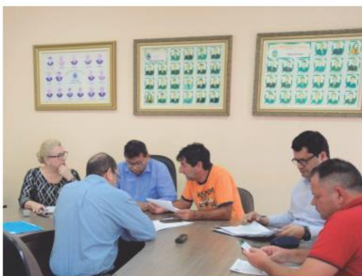
Vereadores vão iniciar a discussão do orçamento da prefeitura de Foz para 2020