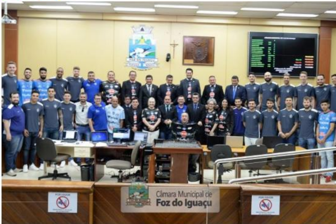
Vereadores destacaram o papel da instituição para o esporte iguaçuense