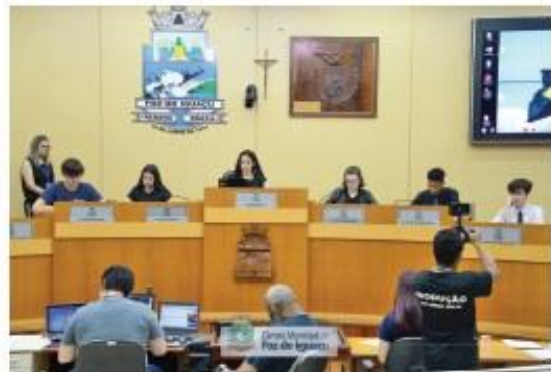
Membros mirins aprenderam como ocorrem os trâmites de uma sessão parlamentar

A eleição dos vereadores mirins foi realizada como qualquer outra eleição, com o uso de urnas eletrônicas, campanhas