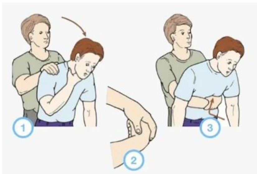
A manobra de Heimlich para desengasgar adultos

7 Outubro, 2019 By Vinicius Ferreira — Deixe um comentário