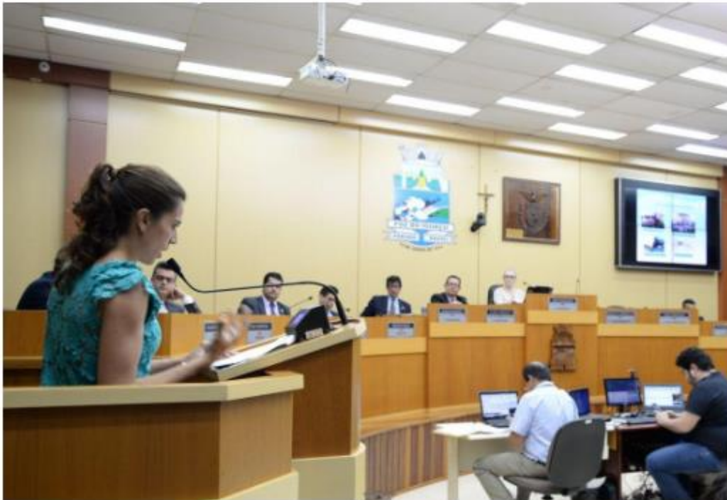
Voluntários da Nosso Lar falaram na tribuna da Câmara

O recurso que os voluntários pedem aos vereadores seria destinado ao projeto Conviver, onde existem espaços terapêuticos comunitários e individuais de prevenção e promoção da saúde mental infanto-juvenil. Na última sessão ordinária do mês de outubro, voluntários da Fundação Nosso Lar se inscreveram para utilizar a tribuna popular da Câmara Municipal de Foz do Iguaçu. O espaço livre é assegurado pelo Regimento Interno sempre na última sessão ordinária do mês e reservado para representantes de entidades, instituições e outras organizações sociais.