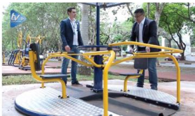
Parquinhos adaptados promovem a integração para crianças com deficiência

As crianças com deficiência física podem divertir-se nos parquinhos da Avenida Paraná e na praça da Avenida Mário Filho. A criança cadeirante pode brincar de maneira segura. "Eu acho isso muito importante, pois pela manhã quando venho caminhar vejo as pessoas normais fazendo exercícios. Então os deficientes físicos também teriam que ter o direito, não é mesmo? Agora com a instalação vai ficar maravilhoso, pois eles vão se