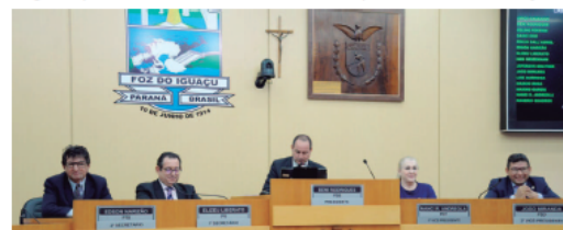
Vereadores apresentaram novos projetos, que seguem para as comissões técnicas da Casa para início de tramitação

Ainda de autoria do Executivo chegou um projeto que prevê a renovação automática da licença sanitária anual para empresas que atuam nas atividades consideradas de baixo risco. A iniciativa atende aos objetivos do Programa Destrava Foz.