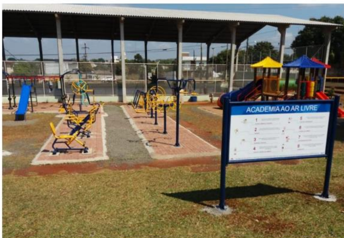
Academia ao ar livre contempla idosos e crianças

Espaços públicos de convivência social e voltados para prática de atividade física nos bairros são de suma importância para a qualidade de vida da população. Pensando nisso, a vereadora Nanci Rafagnin Andreola (PDT) fez uma emenda impositiva destinando recursos para reforma da quadra do bairro Parque Imperatriz. A emenda 57/2017 destinou 180 mil reais do orçamento para aplicação nesse espaço do bairro. Os recursos da vereadora também foram usados para a academia a céu aberto do local, voltada para atividades físicas da terceira idade.