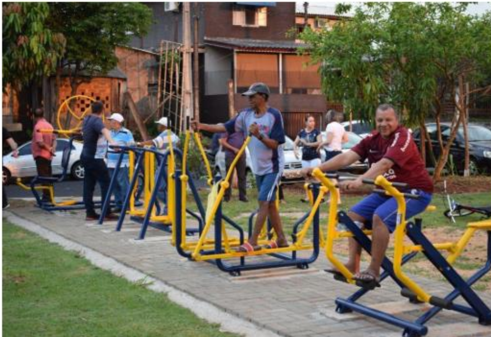
Moradores aprovam os equipamentos instalados

No final da tarde de ontem (15), a Prefeitura Municipal de Foz do Iguaçu fez a entrega oficial de uma academia ao ar livre na Vila Shalon, bairro Três Fronteiras. O ato contou com as presenças do prefeito Chico Brasileiro, de vereadores e membro da comunidade.