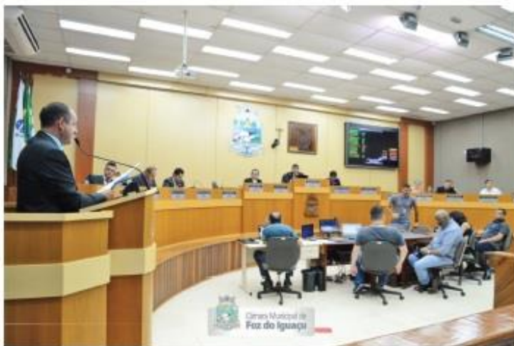
Os projetos foram aprovados na sessão dessa sexta-feira (18)

Ambos os projetos seguem para a sanção do prefeito Chico Brasileiro