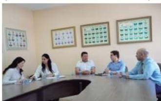
Vereadores se reuniram com representantes da Abracrim e da Comissão de Compliance da OAB