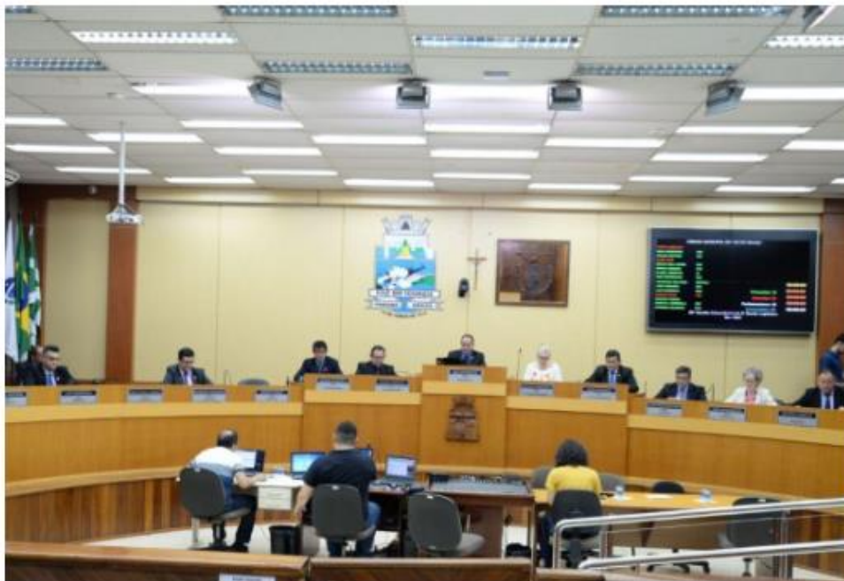
Assunto será discutido na sessão de hoje no plenário da Câmara

A permissão para o credenciamento de empresas visando a captação de recursos para os eventos realizados pela Fundação Cultural recebeu parecer favorável das Comissões Reunidas da Câmara. O documento foi lido em sessão extraordinária da Câmara Municipal de Foz do Iguaçu dessa quinta-feira, 17 de outubro. O projeto deve entrar em votação na sessão extraordinária de hoje (18). Na semana passada, os integrantes das comissões se reuniram com representantes da Fundação Cultural e a Prefeitura enviou um substitutivo ao projeto original, acatando as sugestões dos vereadores.