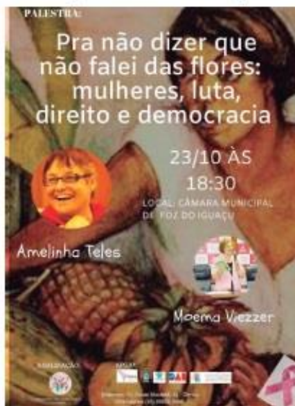
Cartaz de divulgação da palestra na Câmara amanhã à noite