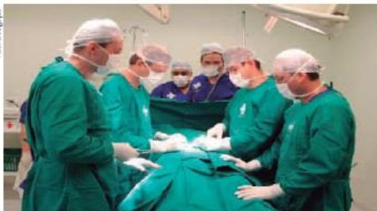
Neste ano estão abertas 22 vagas para residentes em várias especialidades

tério da Educação (MEC), e médicos estrangeiros ou brasileiros graduados em escolas estrangeiras com diploma devidamente revalidado no Brasil.