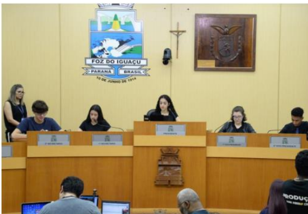
Membros mirins aprenderam como ocorrem os trâmites de uma sessão parlamentar

Na manhã dessa sexta-feira (4) foi realizada uma sessão ordinária simulada do projeto Parlamento Jovem com os vereadores mirins ocupando lugar nos trabalhos do plenário da Câmara. Na reunião, os participantes do projeto apresentaram projetos de lei e indicações para a cidade. Os jovens ainda contaram com a presença de pais e dos vereadores da Câmara Municipal de Foz do Iguaçu que os acompanham para a realização desse projeto.