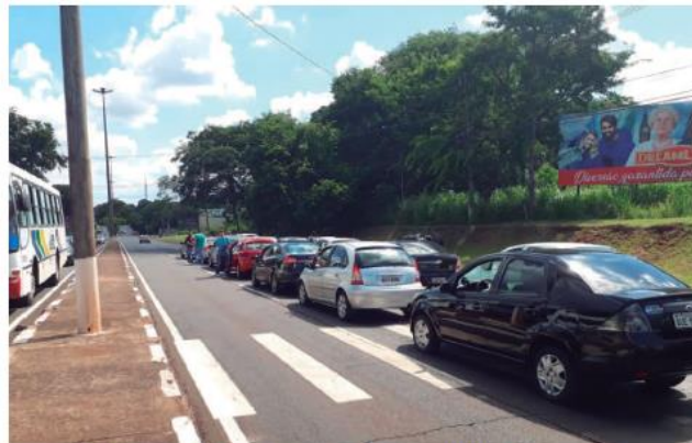
Câmara vota nesta manhã projeto de adequação à lei de condutores de passageiros com auxílio de plataformas digitais

Na prática, os operadores do serviço de transporte remunerado com auxílio de aplicativos terão unificados tributos como o Imposto Sobre Ser-