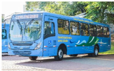
Já entraram em operação os primeiros ônibus do transporte público equipados com os aparelhos de ar-condicionado.

Lei já foi sancionada pelo Executivo, como 'moeda de troca' para implementação de ar-condicionado no transporte coletivo