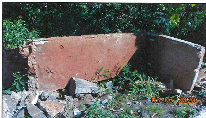
Figura 6 - Parte danificada da aduela existente.