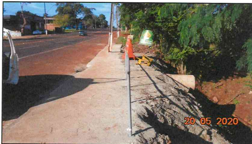
Figura 4 - Passeio executado em concreto.