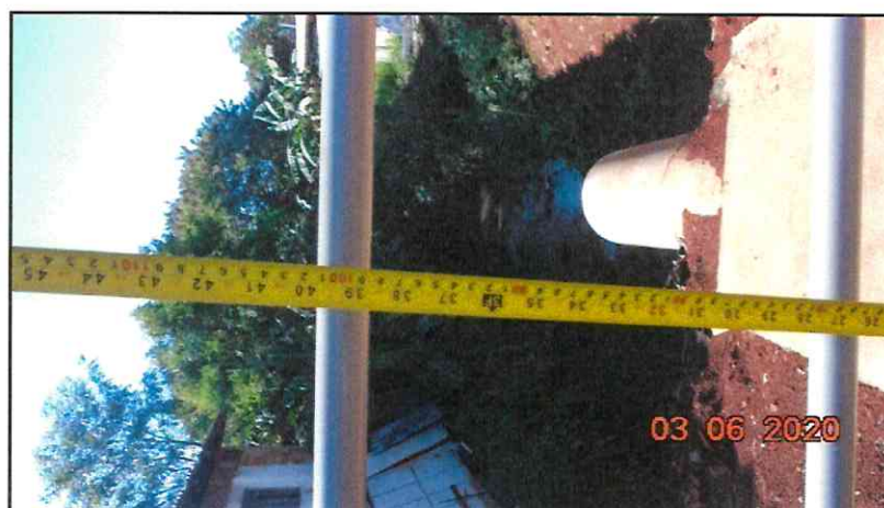
Figura 3 – Guarda-corpo executado com altura de 100 cm.