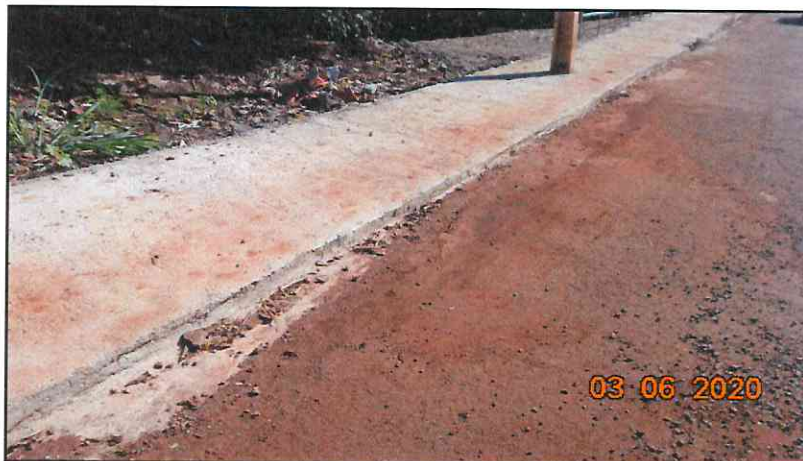
Figura 11 - Meio-fio não executado.