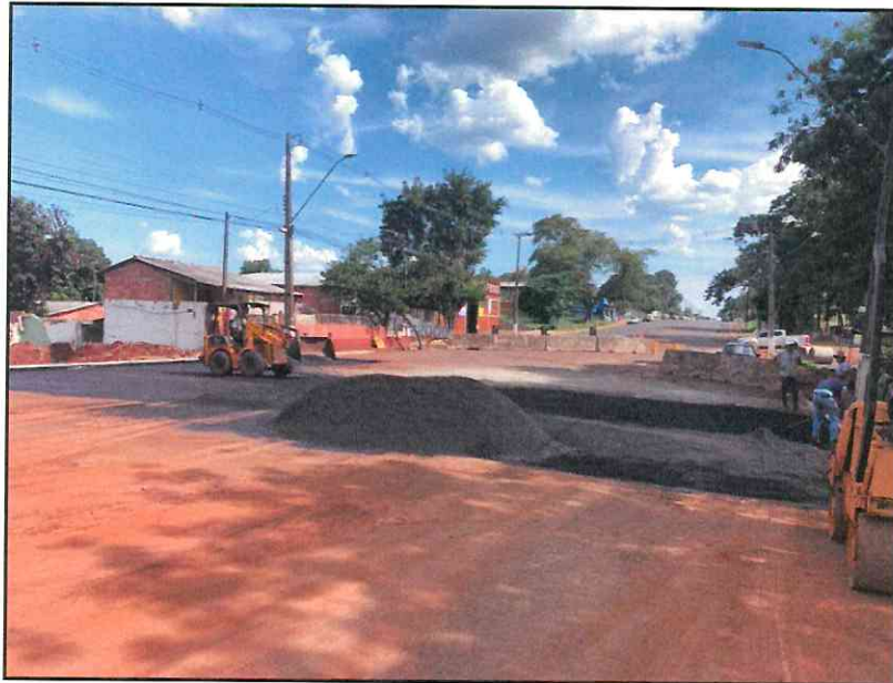
Figura 10 - Material para recomposição asfáltica.