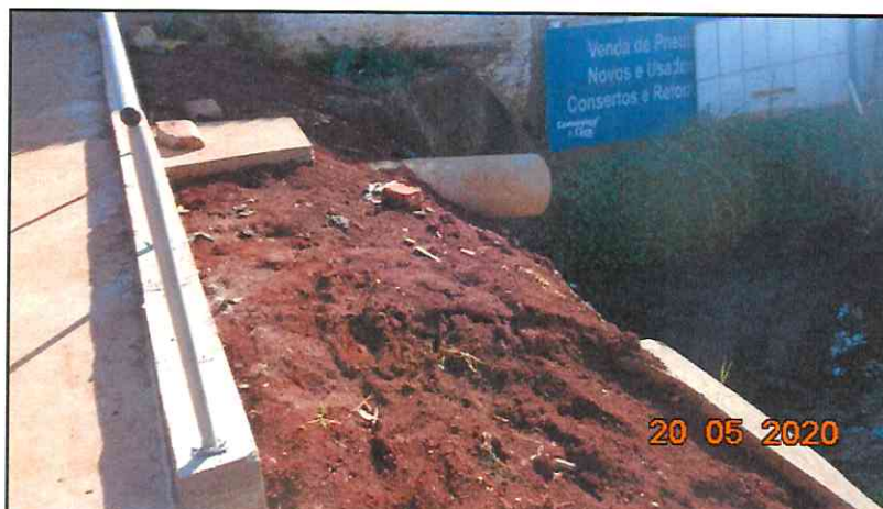
Figura 13 - Saída da boca de lobo com tubo em concreto.