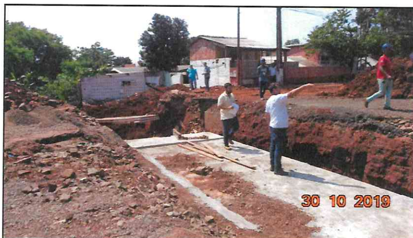
Figura 7 - Pavimento asfáltico demolido.