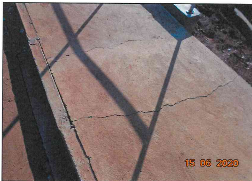
Figura 5 - Fissuras no passeio a jusante