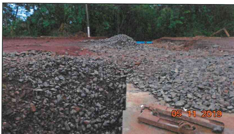
Figura 8 - Reaterro em material granular - Rachão.