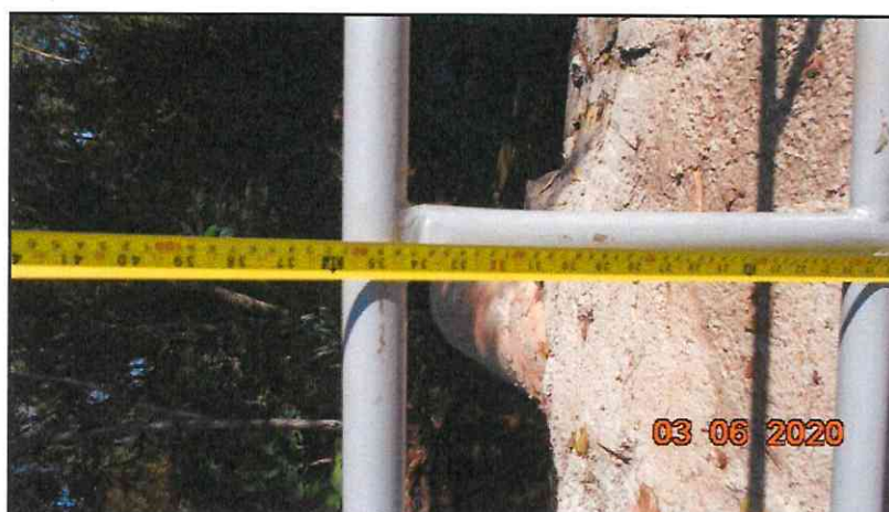
Figura 2 – Guarda-corpo executado com altura de 90 cm.