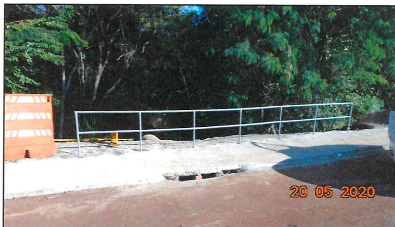
Figura 1 - Guarda-corpo executado.