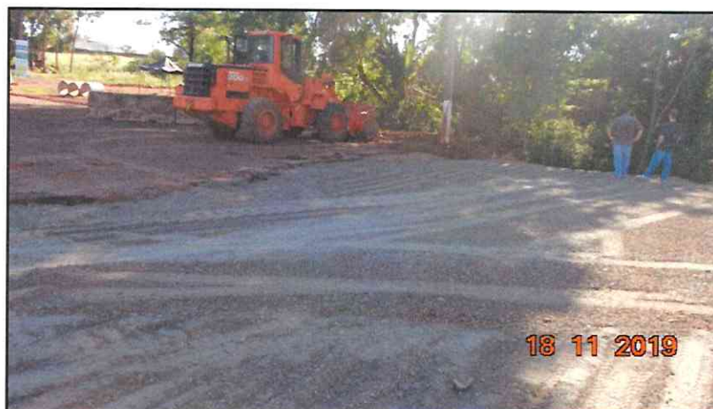
Figura 9 - Base executada em BGS.